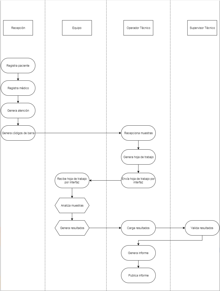
Figura II-1 Ingreso de Pacientes